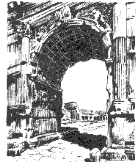
Titusbogen mit Kolosseum

Diese genannten Programmpunkte werden jedoch nur in Kleingruppen, die sich selber finden und organisieren, angeboten. Gerne bieten wir aber für kleine Gruppen eine Begleitung an, sofern dies bereits bei der Anmeldung unter Angabe des Programmpunktes gewünscht wird.