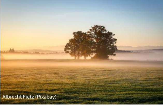
Albrecht Fietz (Pixabay)

„Bunt sind schon die Wälder Gelb die Stoppelfelder Und der Herbst beginnt Rote Blätter fallen Graue Nebel wallen Kühler weht der Wind [...]